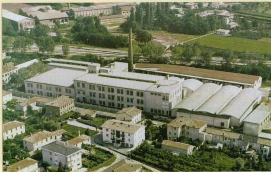
Filatura di Montebelluna negli anni '70