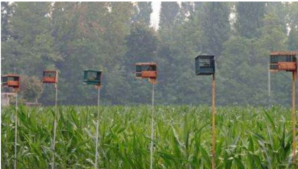
... "tordine" .