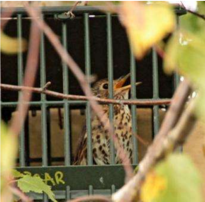
Tordo bottaccio, in gara, (Turdus philomelos).