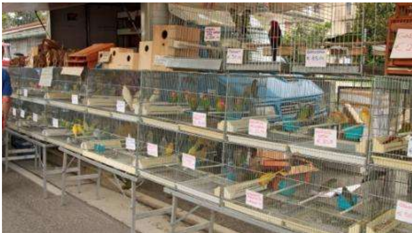
BERGAMO LUIGINA con il gruppo esotici.