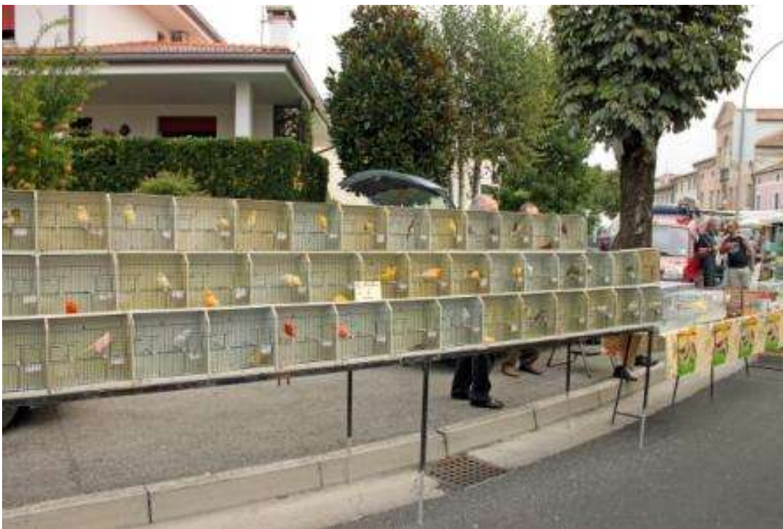
Gruppo canarini del sig. MARTELLOZZO SAMUELE.