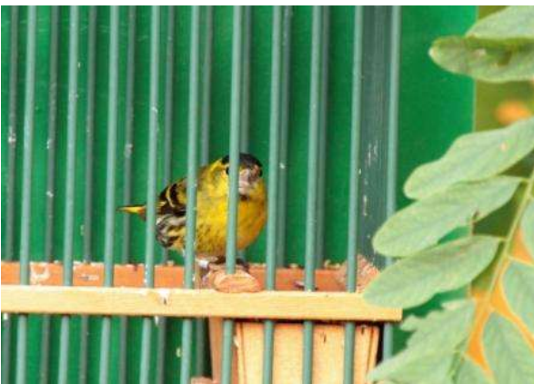
Lucherino (Carduelis spinus).