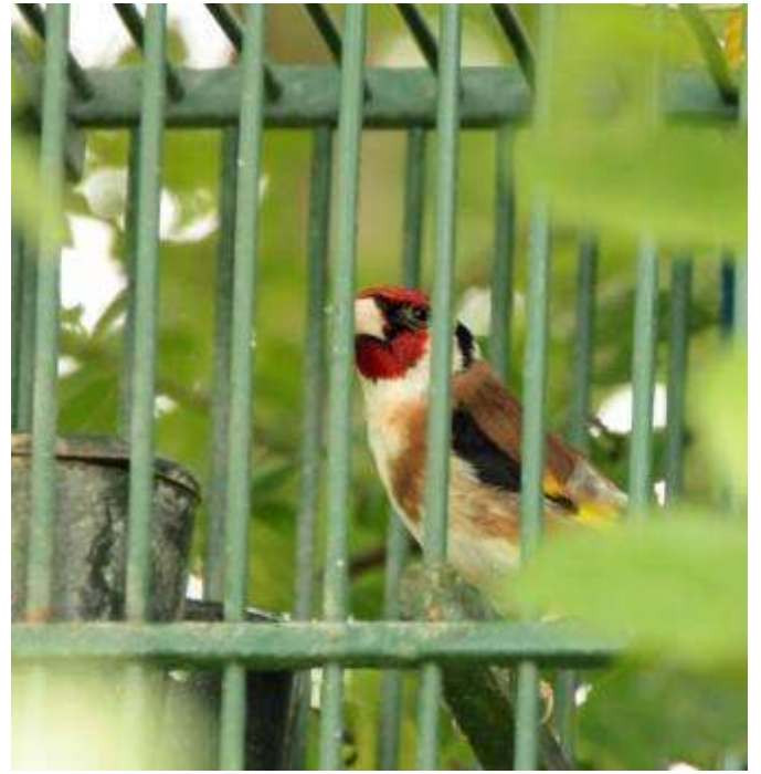
Cardellino (Carduelis carduelis).