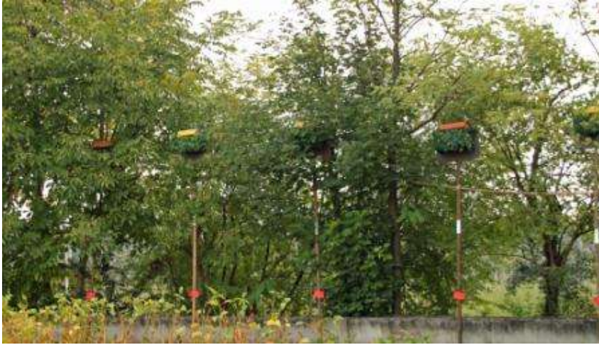
Campi di gara dei canori : merli .