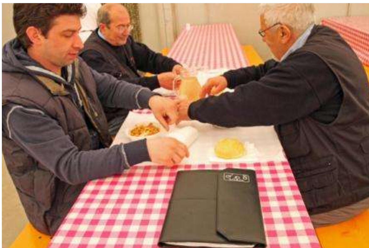
Giudici in "pausa".