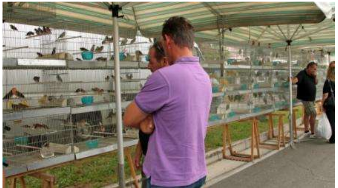
L'ARCA di NOE' con il gruppo esotici.