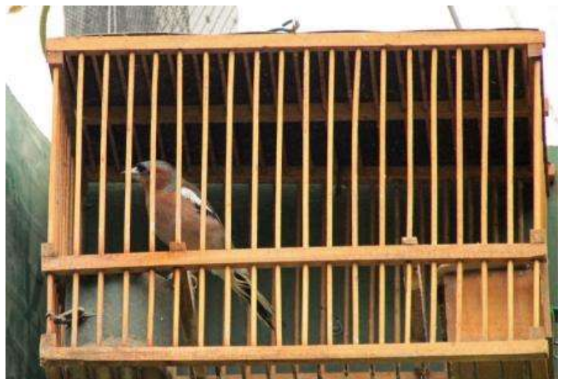
Fringuello (Fringilla coelebs).