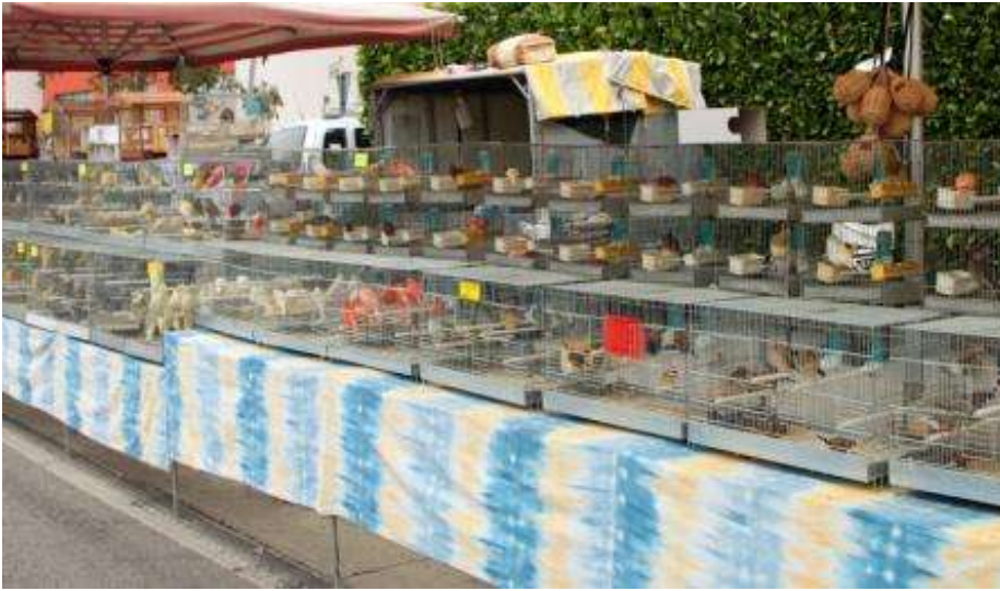
Stend del sig. RAGAZZO VITTORIO con il gruppo esotici.