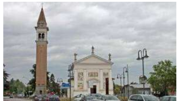
Chiesa arcipretale di VARAGO.