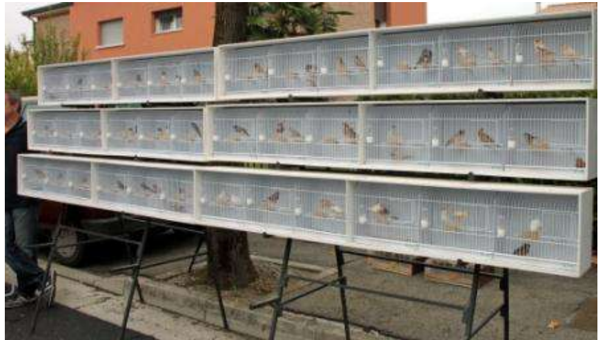
Gruppo esotici di piccola taglia del sig.